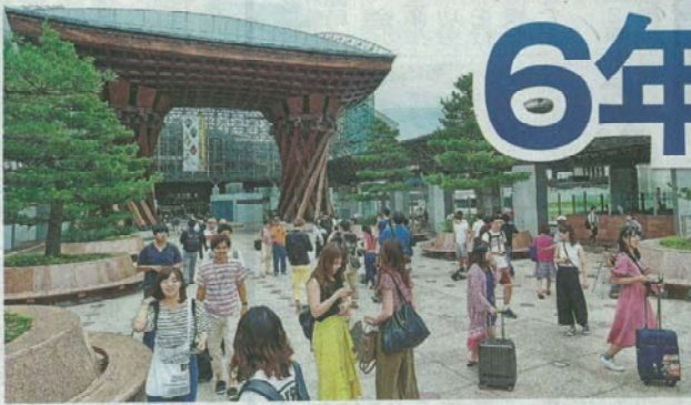
北陸新幹線金沢開業以前の2012年に比べ、路線価が約7割高くなった金沢駅東広場通り周辺。金沢市堀川新町