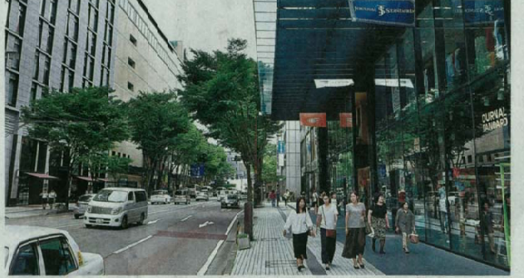
金沢市中心部から金沢駅に至る都心軸の路線価は大きく上昇した一同市香林坊2丁目